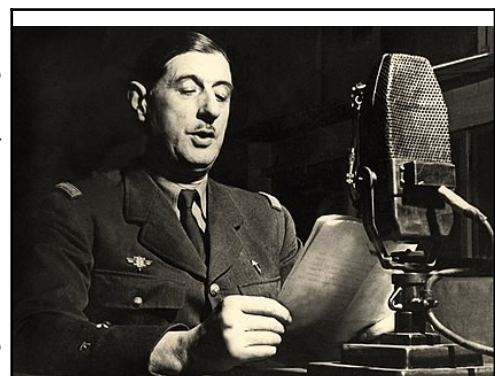
Illustration 8: De Gaulle au micro de la BBC, wikipedia