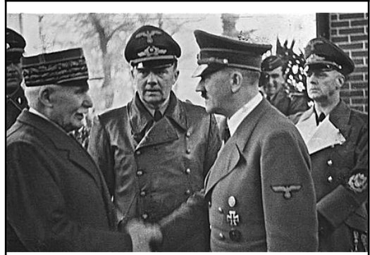
Illustration 6: 24 Octobre 1940, entrevue de Montoire