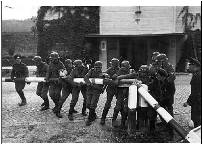
Illustration 1: Soldats allemands arrachant la barrière à la frontière germano-polonaise le 1er septembre 1939, wikipedia