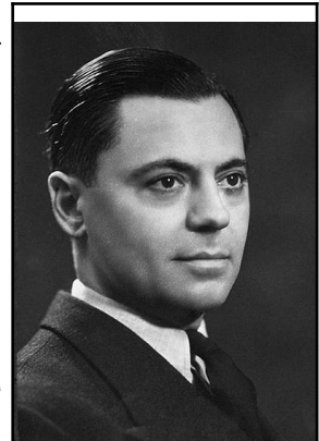
Illustration 9: Jean Moulin, 1937, wikipedia