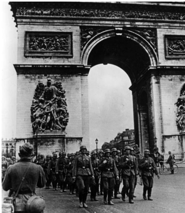
Illustration 2: 14 juin 1940, Deutsches Bundesarchiv