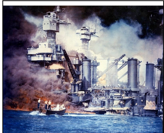
Illustration 3: Attaque de Pearl Harbor, 7 decembre 1941, Le sauvetage des marins du West Virginia au milieu des flammes.