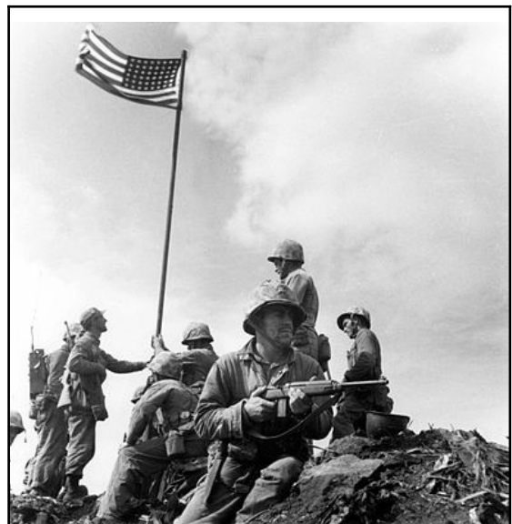
Illustration 4: Drapeau américain sur le mont Suribachi