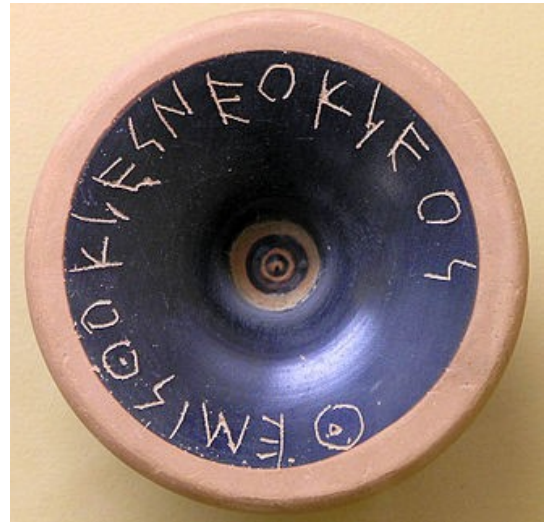
Illustration 1: tesson d'ostracisme au nom de Thémistocle